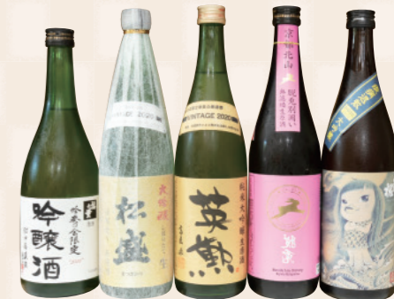
吟奏の会限定の「福無量」1,350円、「松盛」2,040円、「英敷」1,990円。「脱兎」1,870円や「出羽桜 アマビエさま」1,540円など珍しいお酒も。(全て税抜)