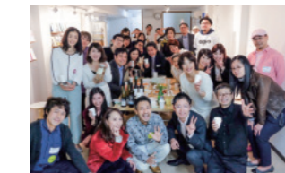
飲食無料の交流イベント「スナック サンクチュアリ」。※現在はオンライン開催。

方などにご登壇いただくイベントや、読者や地域の方のネットワークを作るための交流会なども開催中です。「文(ふみ)の京(みやこ)」と呼ばれるこの町で、日本中、世界中、そして地元の方にも喜んでいただけるコンテンツを発信していきたいと考えています。