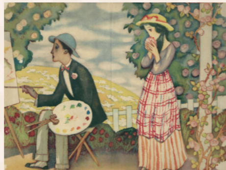
竹久夢二・画「善哉の戯れ」

弥生式土器発掘ゆかりの地 明治17年にこの地で赤焼きの壺が発見され、発見地の地名をとり「弥生式土器」と名付けられたことに由来する石碑。