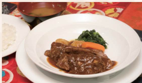
日替わりランチ「スベアリの赤ワインソース煮」は、なんと670円(税込)! 3時間半じっくり煮込んだお肉が、口の中でホロッとほぐれます。