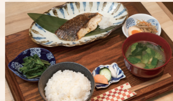
ご飯に味噌汁、副菜2品と漬け物もついた贅沢ランチメニュー「黒むつ西京焼」950円(税込)。ご飯の大盛りが無料なの嬉しいポイント。