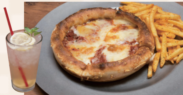
イトインではオリジナルシーズニングの効いたフライドポテトが付いてくる「SUPER PIZZA」1,000円。「自家製レモネード」500円も一緒に! (全て税抜)